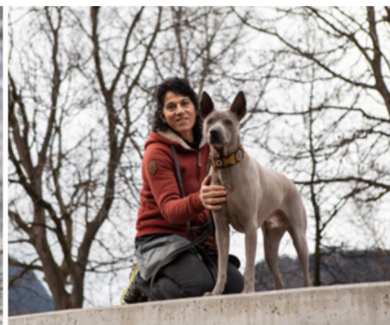
mit Tierschutzhund Jharo