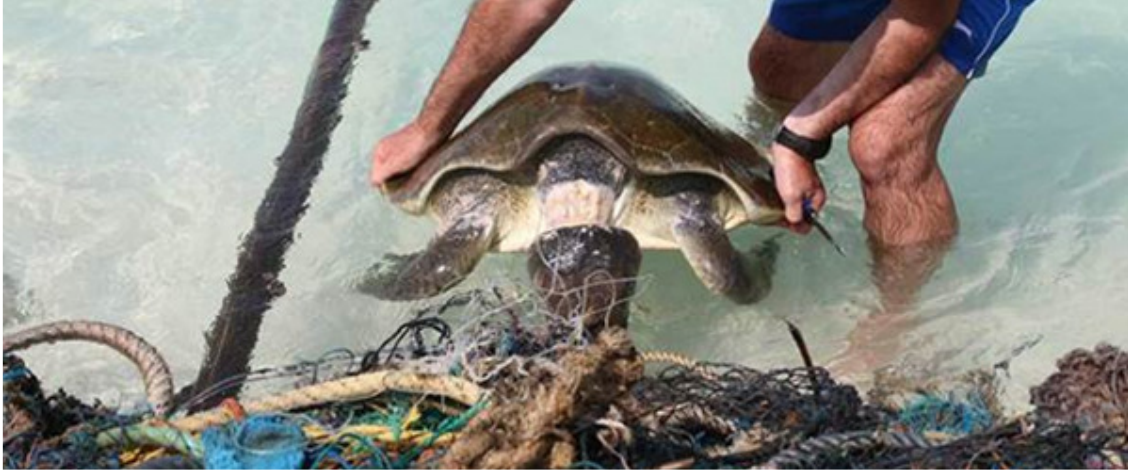
Diese Meeresschildkröte hatte Glück und wurde gerettet