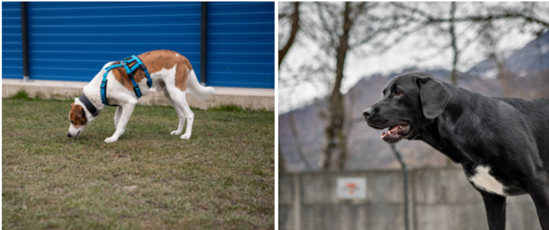
Stellvertretend für die «foundation-Gang» die Tierschutzhunde Ailani und Zeno

Kundinnen und Kunden, euren Freundinnen und Freunden vorstellen und bewerben. Wir freuen uns riesig darauf und hoffen, dass wir durch unsere Auftritte viele neue Paten und Patinnen gewinnen. Ganz egal, wie hoch der Beitrag ist. Mit diesen monatlichen Spenden könnten wir selbst Beiträge leisten. Patenschaften würden sicher helfen, oder Chefin?»