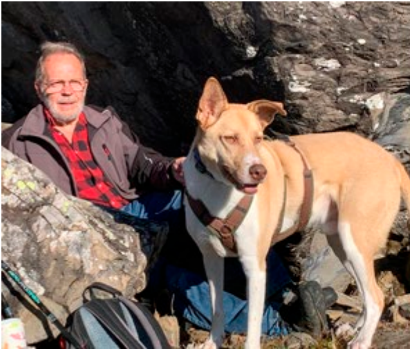
Noldi mit Jack und