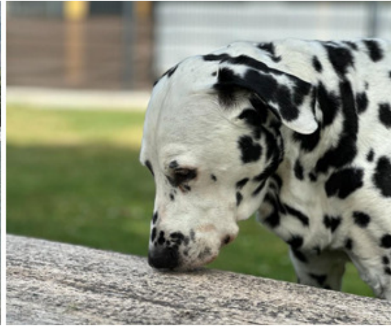
Stellvertretend für alle unsere wunderbaren Gäste